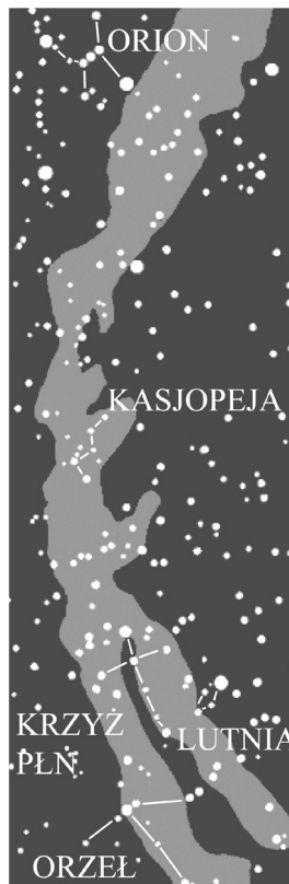
Rys.1 Kosmiczne drzewo Drogi Mlecznej

Pani niebios, w jej młodzieńczej postaci utożsamianej w starożytności i średniowieczu najczęściej z poranną, pozostającą przy Słońcu planetą Wenus, towarzyszyło dwóch młodzieńców, Synów Niebios. Jeden był jasny i słoneczny, drugi ciemny i księżycowy. Rywalizowali ze sobą 1 G. Niedzielski, Drzewo świata. Struktura symboliczna słupa ze Zbrucza , Wydawnictwo Armoryka, Sandomierz 2011