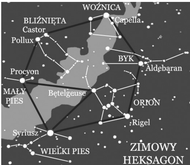
Rys. 2 Zimowy Heksagon

się i opadając, dwukrotnie w czasie cyklu rocznego, w zimowe i letnie przesilenie, ulega przemianie i przechodzi przez świat środkowy, zamieszkały przez ludzi, gdzie jego ziemską postać ukazuje konstelacja Woźnicy.