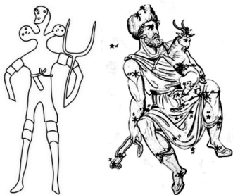
Rys. 5 Figurka z Sardynii i konstelacja Woźnicy

rozwidlony”. 13 Od niego pochodzą: krokva – „krokiew, drewniana rosocha wkładana na stromy szczyt strzechy, kozioł – stojak” i kraczać – rozwidlać, rozstawiać. Podobne źródło mają, łotewskie krakis – „rogi u dachu” i rumuńskie cracă – „rosochata gałąź, rozwidlenie”. Dołączyć do nich można: kruka, krukwa, krukiew, kryka – „kostur, szczudło – kij, drąg z hakiem, ożóg”, czyli gruby kij z odstającym na bok kawałkiem gałęzi, rodzaj osęka używanego m.in. przez kowali do wygrzebywania żużlu z paleniska. Czy jednak można połączyć z sobą smoka oraz „coś rozwidlonego, rogatego”? 14