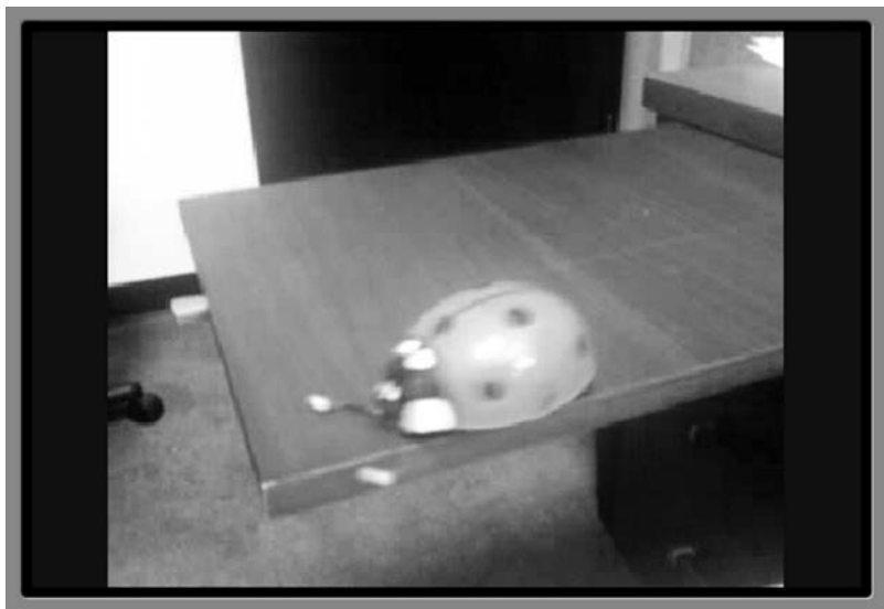
Rysunek 5.3. Dzięki klasie VideoView wstawianie plików wideo nie stanowi problemu