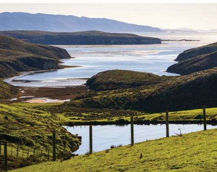
Point Reyes National Seashore