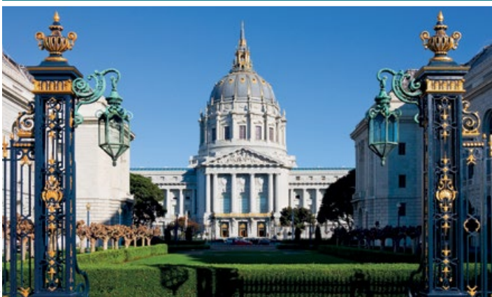
Dumna sylwetka City Hall

10.00–17.00 (do 21.00 w czw.) – 15 USD, czw. po 17.00 5 USD, 1. nd. miesiąca wstęp wolny.