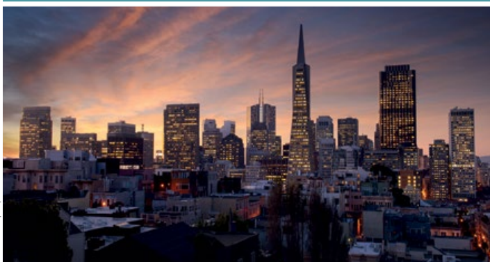
Nocna panorama San Francisco

Merchants Exchange Building – 465 California St. Przed laty sala dawnej Giełdy Zbożowej, ozdobiona marynistycznymi dziełami irlandzkiego malarza Coulttera ( sala niedostępna dla zwiedzających, ale warto obejrzeć sufit holu California Bank & Trust ), była miejscem spotkań kupców i spekulantów. Miniatury statków ustawione są na 4., 6., 8. i 12. piętrze ( przed windami, 1–2 modele na piętrze ). Wracając na Montgomery St., należy skręcić w prawo.