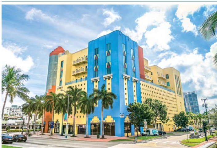
Washington Avenue – budynek w stylu art déco

Budynek jest doskonałym przykładem architektury powstałej w okresie przeprowadzonych w latach 30. robót publicznych. Styl ten określa się