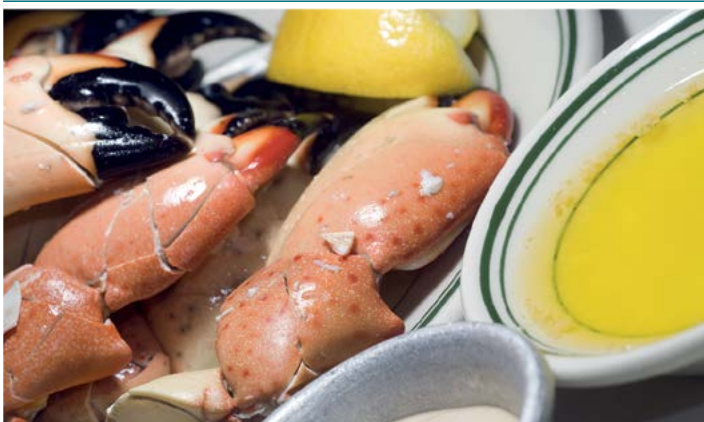
Floryda słynie z owoców morza