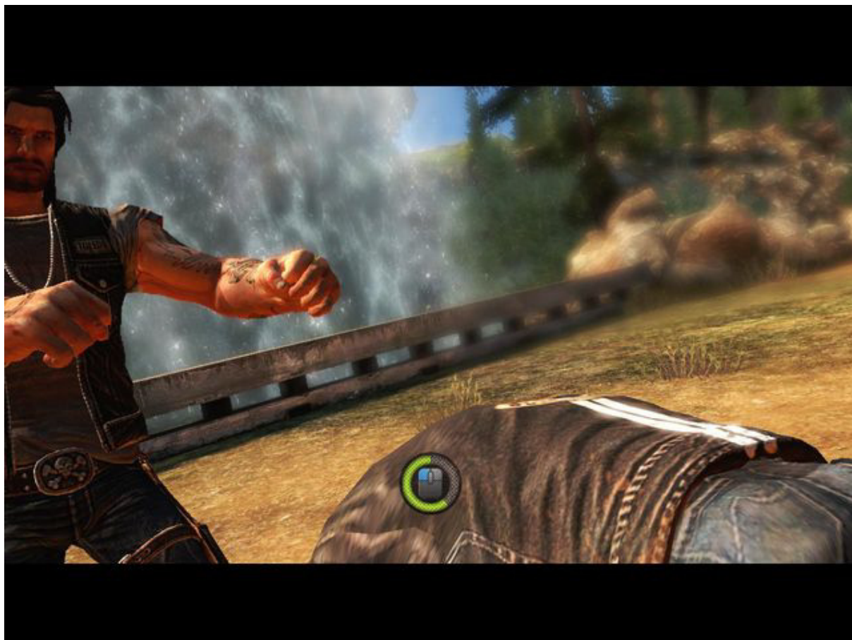
Nauka skutecznej walki wręcz

Po chwili oddechu nauczymy się, jak wykonywać brutalną ataki w walce wręcz. W scenkach interaktywnych należy wykonywać myszką pokazane gesty lub też wciskać szybko wskazany klawisz.