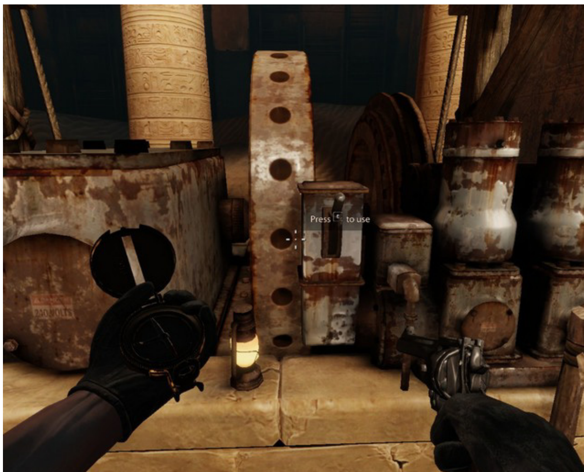
Ukazana wajcha uruchomi windę

Po chwili przejście będzie czyste, a ty będziesz mógł ruszyć po schodach do świątyni. Ruszaj do środka. Gdy będziesz wewnątrz po chwili znajdziesz wewnątrz dość dużą, starą windę. Użyj przełącznika po prawej by zjechać na dół.